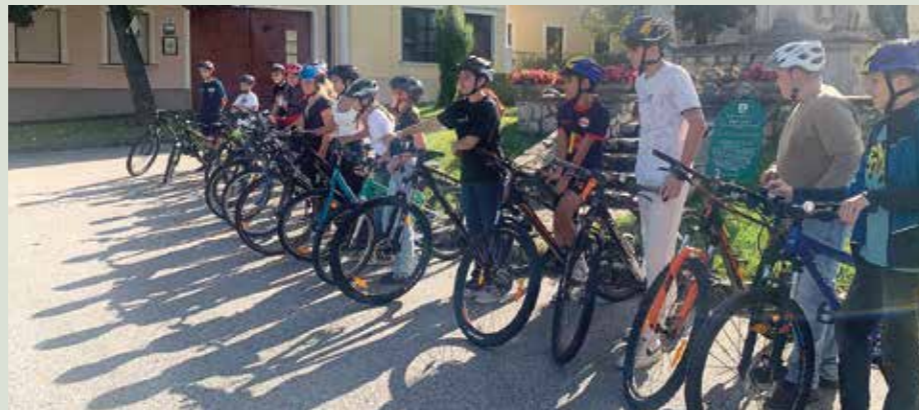
Sicher unterwegs! So wurden bei den Radworkshops zum Beispiel die eigenen Räder auf ihre Verkehrstauglichkeit geprüft.