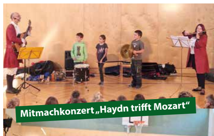
Mitmachkonzert „Haydn trifft Mozart“