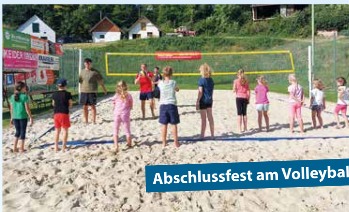
Abschlussfest am Volleyballplatz Obersulz