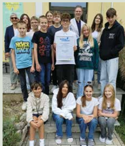
Wir sind Bundessieger beim SIPCAN Wettbewerb – Schlau trinken, schlau recyceln. Glückwunsch!