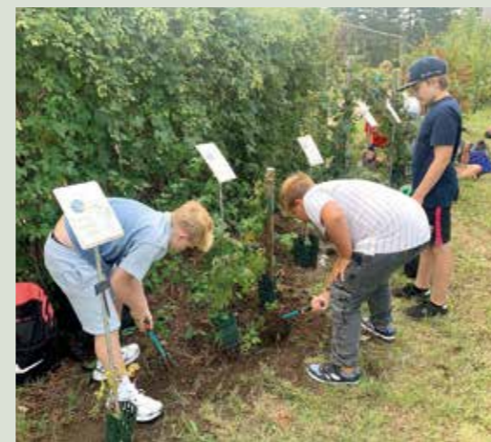
Im Windradl-Obstgartl angekommen – wurden nach einer Stärkung neue Patenschaften übergeben und fleißig gegartelt.