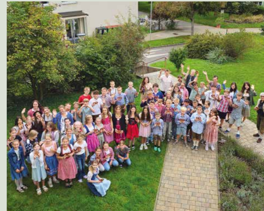
Am Dirndlgwandmontag folgten viele dem Motto und kamen mit Tracht in die Schule.