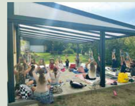
Das Lesepicknick unserer 1. und 2. Klasse in unserem Schulgarten – ein stimmungsvoller Auftakt in das neue Lesejahr.