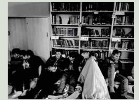
Sprachkunst trifft Spuk! Im Gruselkabinett zu finden waren die 2. Klasse und Goethes Zauberlehrling und Erlkönig.

Besuchen Sie uns auch online: aktiv-ms-hohenruppersdorf.jimdofree.com