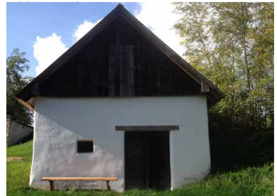
So zeichnen kleine Kinder Häuser: Das traditionell sanierte Presshaus in der Obersulzer Ziegelg'stettn.

Die Bauberater des Landes geben dazu klare Empfehlungen: „Verwenden Sie traditionelle Materialien, vermeiden Sie unnötige Verblechungen, setzen Sie auf Türen und Fenster aus Holz – und decken