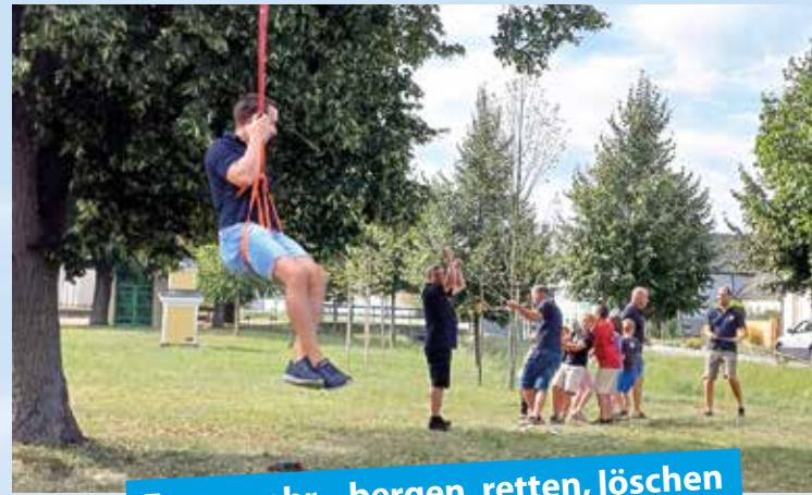
Feuerwehr – bergen, retten, löschen