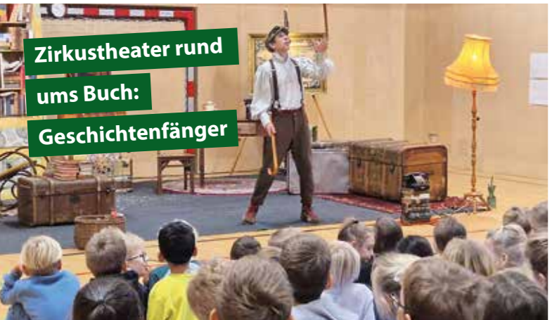
Zirkustheater rund ums Buch: Geschichtenfänger