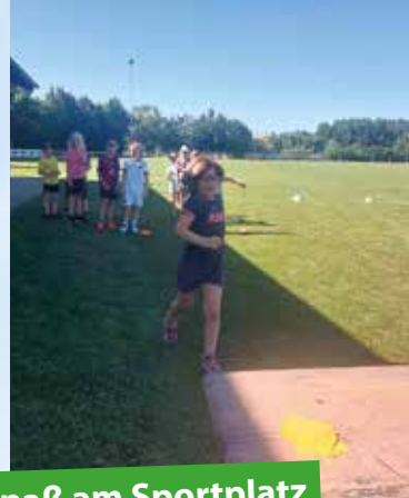
USV Sulz – Sport und Spaß am Sportplatz