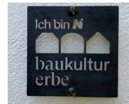
Die Plakette soll als sichtbares Zeichen andere motivieren, ebenfalls eine Sanierung ins Auge zu fassen.

Weitere Informationen sind unter www.noebaukulturerbe.at abrufbar. Für unverbindliche Auskünfte steht auch der Kellerbesitzer gerne per E-Mail zur Verfügung: robert.kuchar@me.com