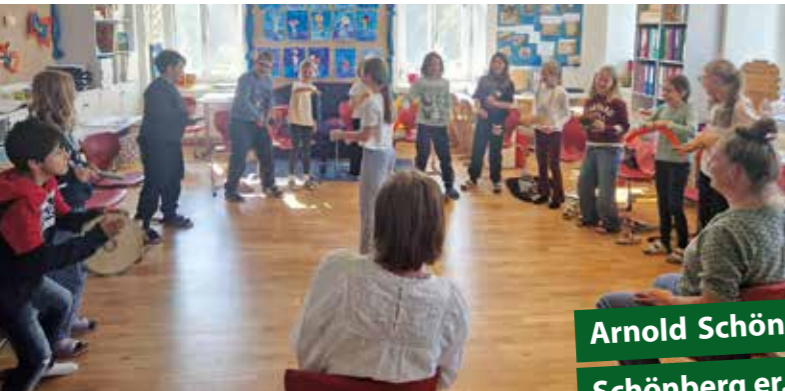
Arnold Schönberg – Workshop: Schönberg er.lebt!