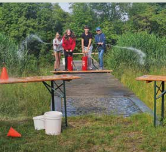
Die 4. Klasse erreichte bei den Wasserjugendspielen in Deutsch-Wagram den hervorragenden dritten Platz – Gratulation!