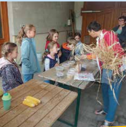
Ein Vormittag am Bauernhof