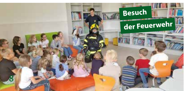
Besuch der Feuerwehr