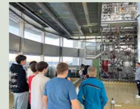
Unsere 4. Klasse besuchte die Lehrwerkstätten und das ITC der OMV in Gänserndorf.