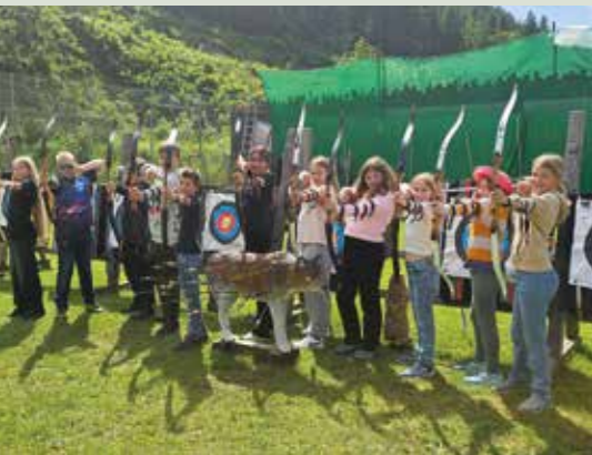
Die 2. Klasse verbrachte Anfang Juni 2025 eine Schwimmwoche in Veitsch