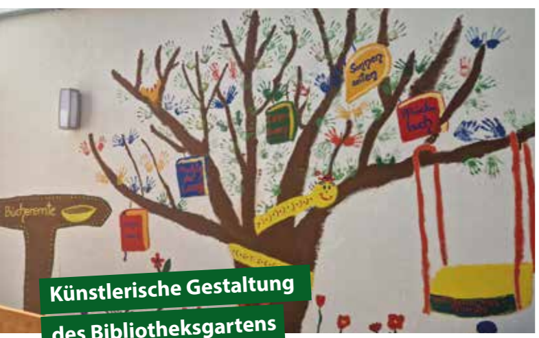
Künstlerische Gestaltung des Bibliotheksgartens